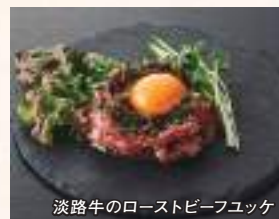
淡路牛のローストビーフユッケ