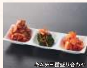
キムチ三種盛り合わせ