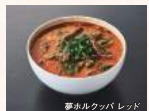
夢ホルクッパ レッド