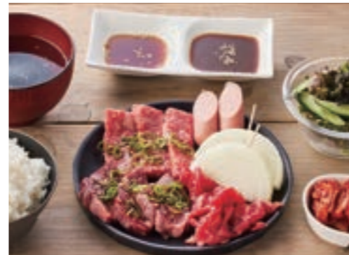
お手軽焼肉 C セット ¥1,980

淡路牛カルビ / 淡路牛肩ロース / 特選ハラミ / 神戸ポーク / 淡路どりもも肉 / あらびきウィンナー / 淡路島玉ねぎ