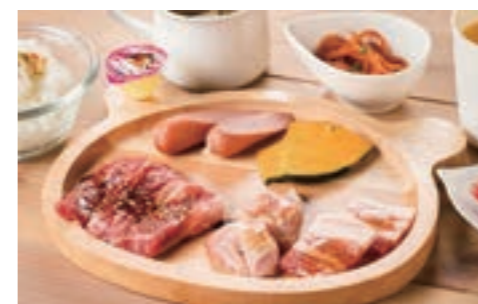
お子さま焼肉セット ¥1,100 ライス・スープ付 ※小学校以下限定

淡路牛カルビ / 神戸ポーク / 淡路どりもも肉 / あらびきウィンナー / 小鉢 / ドリンク