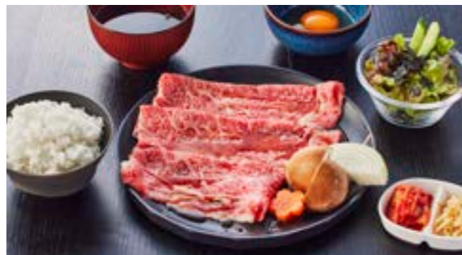
淡路牛特上ロース 150g 焼きすきセット ¥3,550

淡路牛の特選上ロースを焼きすきで堪能できる最高の贅沢セット 割り下は自家製！北坂たまごにつけて召し上がれ♪