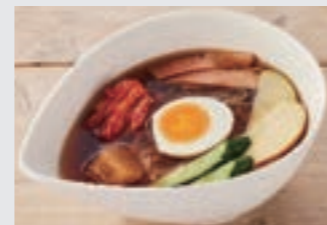
スープ⇒冷麺 + ¥550 ※ライス付き or ライスなしをお選びください。