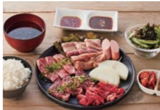
満足焼肉 B セット ¥2,530

淡路牛カルビ / 淡路牛肩ロース / 特選ハラミ / 神戸ポーク / 淡路どりもも肉 / 白モツ / テッチャン / あらびきウィンナー / 淡路島玉ねぎ