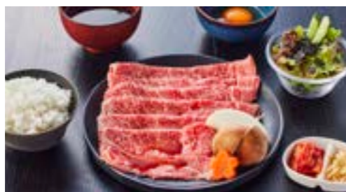
淡路牛特上ロース 300g 焼きすきセット ¥5,990