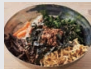
ライス⇒ピビンバ + ¥550