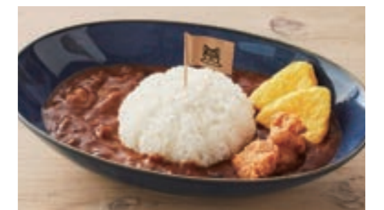
お子さまカレー ¥660 ※小学校以下限定

淡路牛カルビ / 神戸ポーク / 淡路どりもも肉 / あらびきウィンナー / 小鉢 / ドリンク