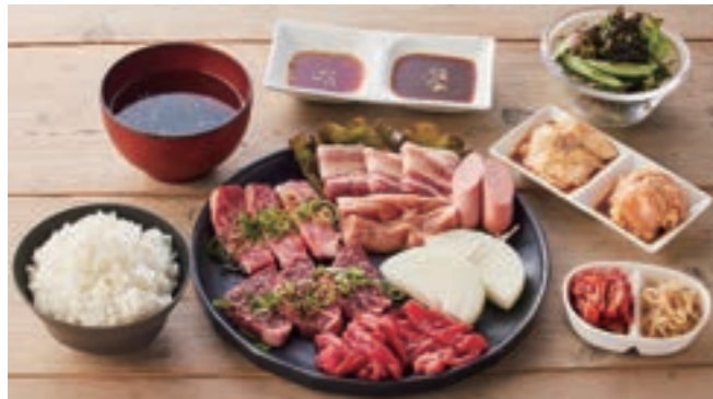
贅沢焼肉 A セット ¥3,080

淡路牛カルビ / 淡路牛肩ロース / 特選ハラミ / 神戸ポーク / 淡路どりもも肉 / 白モツ / テッチャン / あらびきウィンナー / 淡路島玉ねぎ