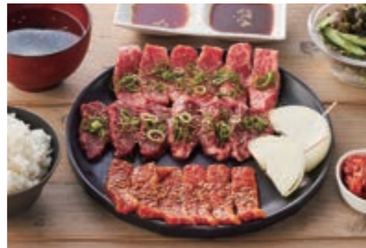
昼から肉三昧セット ¥3,600

淡路牛カルビ / 特選ハラミ / 白モツ / テッチャン / アカセン / あらびきウィンナー / 淡路島玉ねぎ